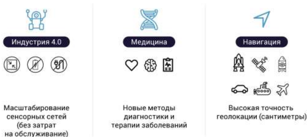
Рис. 3. Области использования квантовых сенсоров в РФ к 2024 г.

Лидирующие организации: АО ИСС им Решетнева; АО РИРВ; ВНИИФТРИ; Время-Ч; ИЛФ СО РАН; ИПФ РАН; ИСАН; ИФТТ РАН; МГУ им. М.В. Ломоносова; МФТИ; НИТУ МИСиС; МИФИ; Объединенный институт ядерных исследований, ФТИ им. Иоффе; ООО «Детектор Фотонный Аналоговый» (ООО «ДЕФАН»); РКЦ; Университет ИТМО; ФИАН им. П.Н. Лебедева; ЦКТ МГУ им. М.В. Ломоносова; Центр перспективных технологий и аппаратуры.